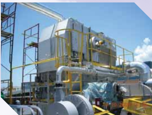
FCI (新加坡) (柔性印刷电路板) 5400 m 3 /h VOC (二 氯甲烷, 甲醇) & HCL (蓄热式焚烧炉和洗 涤塔)