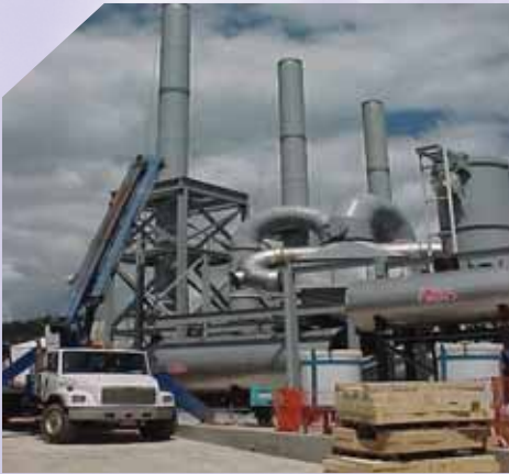
3×30 兆瓦 废液废气焚烧炉 余热回收 尾气净化装置 百时美施贵宝， 美国